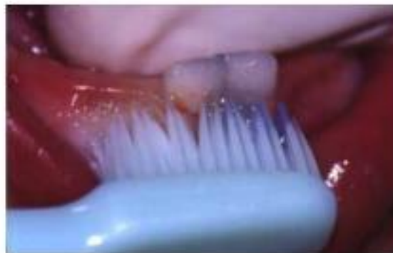
Figura 4. Cepillado de los primeros dientes deciduos.

El uso del cepillo dental se puede iniciar en el momento en el que erupciona el primer diente deciduo. (Fig.4) El objetivo inicial del cepillado es establecer buen patrón de higiene bucal, fortaleciendo la remoción mecánica de biofilm dental de zonas accesibles. Los fabricantes de pastas dentales ofrecen una amplia gama de opciones, algunas con el objetivo específico de estimular la práctica del cepillado de los niños. Con relación a las orientaciones de los profesionales en higiene bucal en infantes, existen una interrogante latente en cuanto a cual pasta dental debe ser indicado como apoyo a los métodos mecánicos de limpieza”.