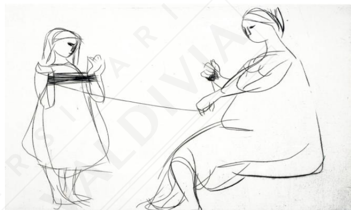
Roser Bru, El hilo . Grabado, buril, 26.2 x 40.4 cm, 1958.

2. Con una formación libre que incluyó lecciones de Pablo Burchard y Nemesio Antúnez, Bru se consagró a la representación de un mundo habitado por mujeres abstraídas, monumentales y silentes, mujeres enfrascadas a veces en tareas cotidianas que parecían ritos religiosos, como si en las tareas cotidianas se escondiera un destino enorme. «El Hilo», un buril 5 de 1958 parece buen resumen de aquello, una mujer de expresión económica y severa dirige su mirada a la hija que, de pie, parece esposada con el hilo que le ayuda a ovillar a su madre. El hilo es una línea, y son líneas las que configuran las formas robustas y monumentales de la mujer que aparece sentada en el aire, sobre un asiento virtual que se intuye en el inmaculado blanco del papel. Aquella obra es una escena y una metáfora. Como en la obra posterior de Bru, la línea es segura, estructural, expresiva.