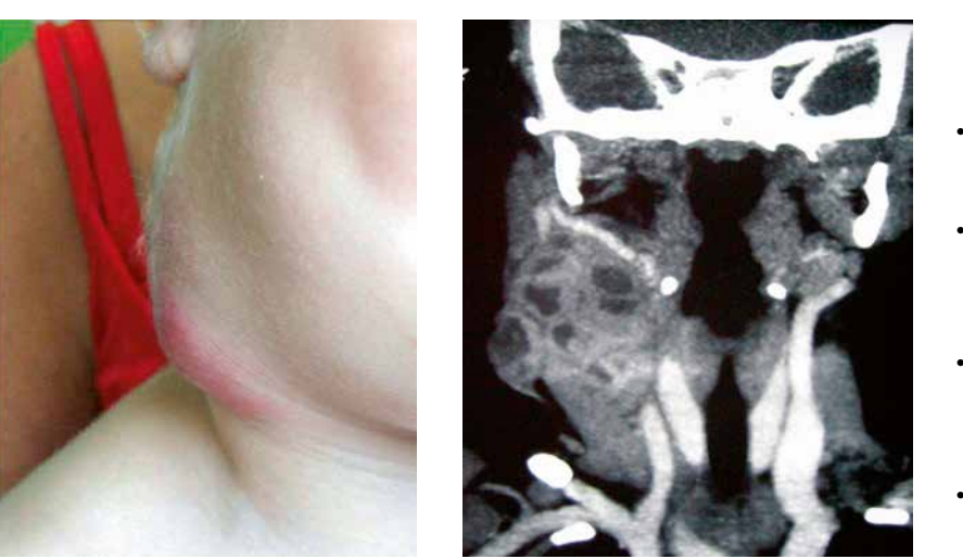
Figura 3. Adenitis tuberculosa.

cervicales sin tendencia a la supuración ni signos inflamatorios locales<sup>(1)</sup>. Las adenopatías suelen ser bilaterales, simétricas y menores de 3 cm.