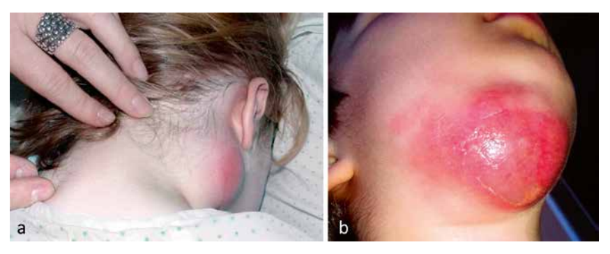
Figura 1. Adenitis bacteriana: a. Sin aislamiento microbiológico; b. Staphylococcus aureus resistente a meticilina.

que aparece en el 10-25% de los casos. En el momento actual, la mayoría de aislamientos de S. aureus en adenitis cervical en nuestro medio son sensibles a meticilina. Se estima que las infecciones por S. aureus meticilín-resistente representan hasta el 13% de las infecciones de piel y partes blandas producidas por este microorganismo, siendo más frecuentes en las familias de origen extranjero<sup>(7)</sup>. Las infecciones por anaerobios suelen aparecer en niños mayores con patología dentaria.