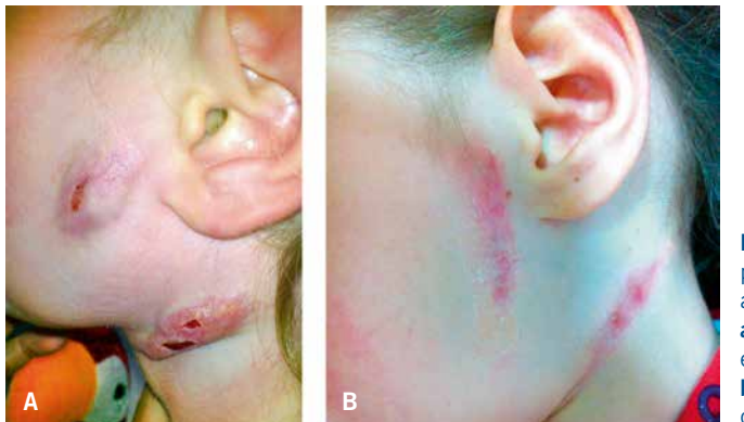
Figura 5. Adenitis por micobacterias atípicas: a. Fistulización espontánea; b. Tras exéresis quirúrgica.