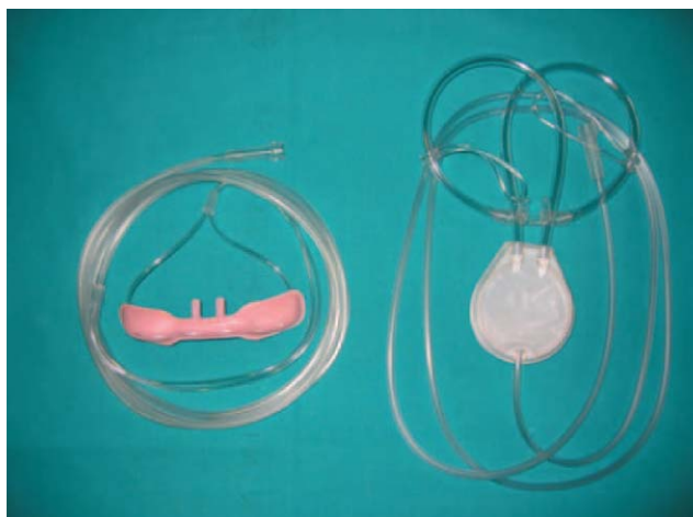
Figura 7 Cánulas nasales con reservorio.

siguientes criterios y que se han proporcionado las instrucciones necesarias para el empleo de este tratamiento 15 :