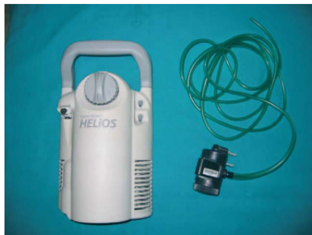
Figura 6 Sistema a demanda: válvula integrada en la bombona de oxígeno líquido y válvula independiente.

pruebas pertinentes. En su caso redundarían en una mejor calidad de vida del paciente y, además, en un ahorro económico nada despreciable ( fig. 7 ) 13,14 .