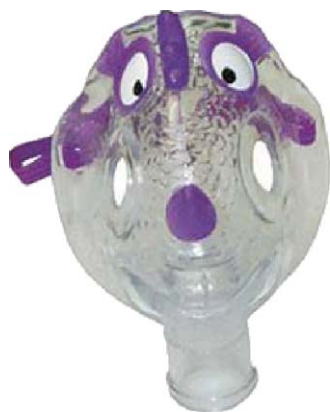
Figura 5 Mascarilla simple.

puede aportar una FiO_2 de 0,4 a 0,7 (del 40 al 70%). Las máscaras sin reinhalación de O_2 son similares a las máscaras de reinhalación parcial, excepto por la presencia de una válvula unidireccional entre la bolsa y la máscara que evita que el aire espirado retorne a la bolsa. Las máscaras de sin reinhalación deben tener un flujo mínimo de 10 l/min y aportan una FiO_2 de 0,6 a 0,8 (del 60 al 80%).