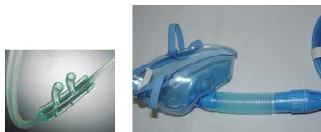
Figura 3 Cánulas nasales y mascarilla Venturi.

Es una campana cerrada y compacta que se utiliza en lactantes. Proporciona un alto grado de humedad y funciona como un sistema de alto flujo si se conecta a un sistema Venturi.