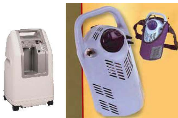
Figura 2 Concentrador de oxígeno ( O_2 ) y mochila de O_2 líquido.

Se basa en que el O_2 líquido a temperaturas muy bajas ocupa menor volumen, de modo que un litro de O_2 líquido libera 850 l de O_2 gaseoso a presión y a temperatura ambiente. Se han desarrollado pequeños tanques para la distribución domiciliaria de unos 40 kg de peso y de unos 20 a 40 l de O_2 líquido. Tienen que recargarse semanalmente. El paciente tiene el tanque nodriza y un dispositivo portátil que va recargando 1,3 l de O_2 y que pesa unos 3,5 kg y le ofrece una autonomía de 7 a 8 h a un flujo de 2 l/min. Hay unas mochilas más pequeñas y de menor peso (2 kg) más adecuadas para los niños. Los tanques y las mochilas se vacían espontáneamente a medida que pasa el tiempo por pérdidas espontáneas (el tanque en 50 días y las mochilas en unas 60 h). Deben almacenarse en zonas ventiladas. Deben revisarse periódicamente tanques y mochilas y, probablemente, es el método de elección en niños si son cumplidores y permanecen mucho tiempo fuera del domicilio. Las características principales y diferenciales de las fuentes se muestran en la tabla 3 1,8,9 .