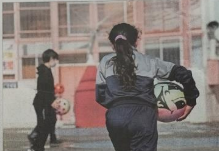
El estudio advierte que ser mujer se asocia con un mayor riesgo de no alcanzar el hábito adecuado de actividad física. Por lo mismo, se pide a los colegios no perpetuar mensajes sexistas.

"No está asociado a una cuestión genética, sino a algo que ocurre culturalmente el género", dice a propósito del dato que señala que ellas tienen un riesgo 2,9 veces mayor de no alcanzar la frecuencia ideal de actividad física semanal, dado que muchas veces sienten que el mensaje de hacer deporte no se dirige a su persona. "Hay una oferta muy masculinizada del deporte, con una oferta tradicional que suele asociarse