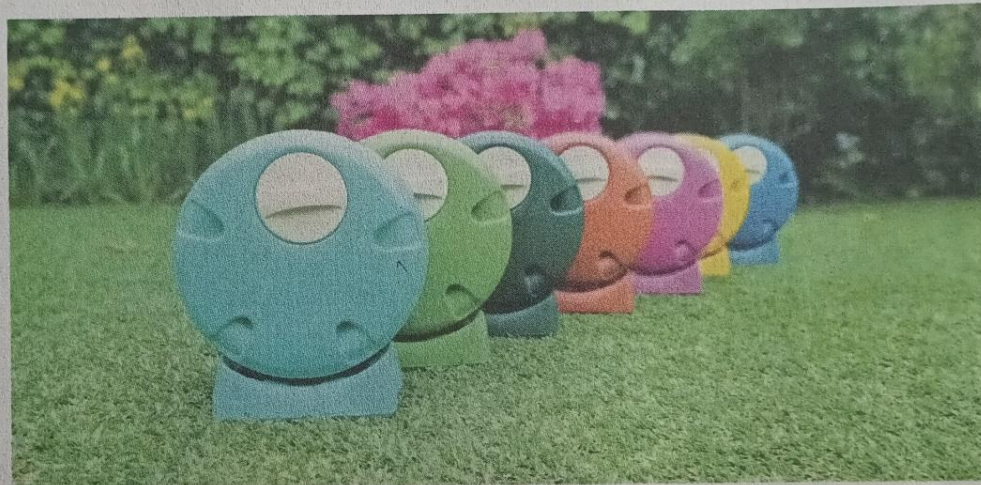
Composteras Gira con almacenaje de líquido.

Asimismo, para brindar soluciones y fomentar el reciclaje en todos los ámbitos, cuentan con líneas de productos específicas y adaptables a distintos públicos: hogares, empresas, colegios, municipalidades, espacios públicos, hospitales. “Vendemos desde Huará, en el norte; hasta la comuna de Primavera, en Cabo de Hornos, unimos todo Chile en pos de ayudar a crear una conciencia