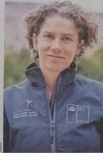
Maisa Rojas, ministra de Medio Ambiente.

Agrega que como país, gracias a la implementación de la Ley del Reciclaje o Ley REP, tenemos desafiantes metas de valorización, pero solo serán alcanzadas si la ciudadanía se suma a la cultura de la economía circular, que incluye al