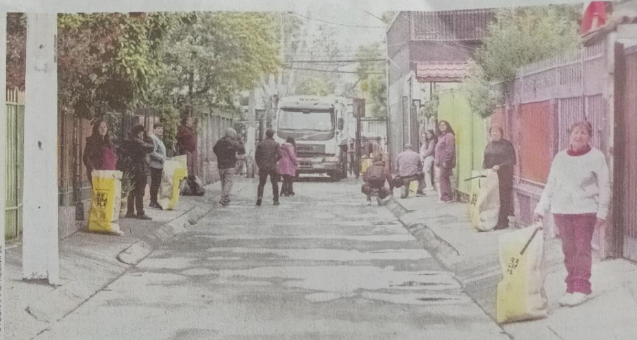
Actividad de reciclaje junto a la comunidad de Renca.

diseñado de cara a los primeros cinco años de ejecución de la ley”. Es así como desde el año pasado que la organización viene desarrollando de forma gradual actividades de capacitación en las comunas donde se encuentra atendiendo a sus comunidades producto de la firma de convenios. Ha realizado numerosos talleres a los equipos municipales, y a dirigentes vecinales, junto con el despliegue de las cuadrillas informativas en los territorios para una adecuada aplicación de la Ley REP.