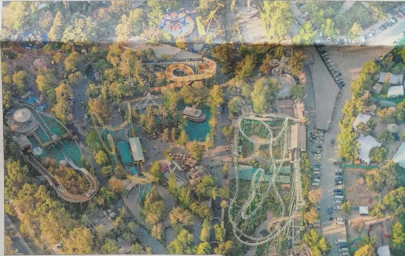
Un total de 40 juegos en una extensión de casi siete hectáreas posee Fantasilandia en un sector del Parque O'Higgins. En su eventual próxima ubicación en San Bernardo, Fantasilandia podrá disponer de cerca de 27 hectáreas para sus entretenimientos.

Sin embargo, esta historia de cuatro décadas podría llegar a su fin en su actual ubicación. "Producto de la natural evolución de Fantasilandia, fue surgiendo la necesidad de buscar nuevas alternativas que permitan su crecimiento en espacio para atender las mayores exigencias de nuestros usuarios", sostuvieron desde Fantasilan-