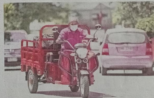
Todo el material recolectado gracias a los diversos proyectos de reciclaje y el trabajo colaborativo junto a los recicladores de base irá a la planta Re-Ciclar para su procesamiento y transformación en nuevos envases.

socios embotelladores, Coca-Cola Andina y Coca-Cola Embonor, va más allá de la recolección: se trata también de transformar los residuos en recursos valiosos. Todas estas iniciativas y acciones están en sintonía con la Ley de Responsabilidad Extendida del Productor (Ley REP) y la Ley de Plásticos de Un Solo Uso (Ley PUSU), legislaciones cruciales