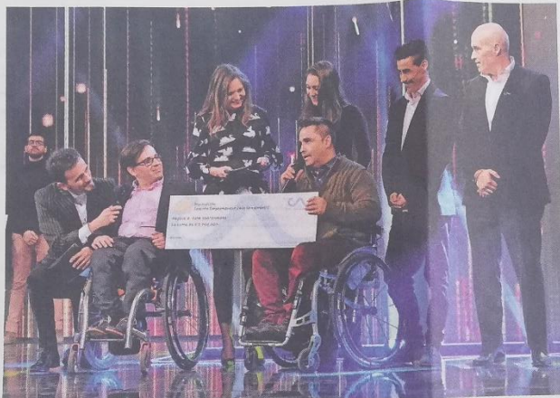
Pato sobre Ruedas fue uno de los proyectos ganadores de los premios TECLA 2 en la categoría Expansión.

“Ala Surfing es un programa inclusivo, orientado a