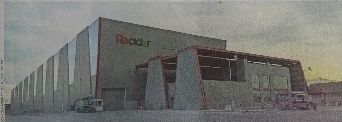
COCA-COLA ANDINA Y COCA-COLA EMBONOR

Con una extensa red nacional de recicladores de base, cooperativas de recolectores, gestores y municipios, esta planta —que cuenta con una inversión de US$ 35 millones— dará una segunda vida a las botellas plásticas.