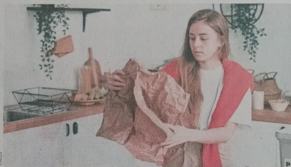
La Ley 20.920 busca promover una gestión responsable de los residuos que generan las empresas.

La principal normativa que rige en este sentido a la industria de envases y embalajes es la Ley REP o la Ley 20.920. Establece que los fabricantes e importadores de productos envasados son responsables de la gestión y reciclaje de los envases y embalajes una vez que se convierten en residuos, que deben ser reintegrados a los procesos productivos a través de tecnologías como el reciclaje.