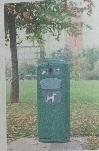
Contenedor y dispensador de bolsas para deposiciones de mascotas.

Al mismo tiempo, agrega que se debe aprovechar lo que Chile ha avanzado en esta materia, haciendo de la transparencia el motor fundamental para un Estado