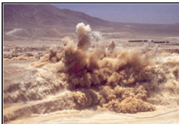
Los detonadores electrónicos aumentan el desempeño de la tronadura porque virtualmente elimina la dispersión de tiempo.

De todo lo anterior se desprende que un requisito claro es el mejor control sobre las operaciones de tronadura a un costo razonable, y Cunningham sostiene que la llegada de sistemas de detonadores electrónicos confiables y fáciles de usar representa una solución para abordar la mayoría de estos