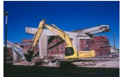
La Park East en demolición