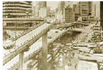
La autopista, poco después de ser terminada