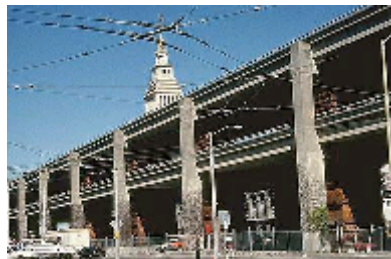
La doble autopista aislando la ciudad del edificio Embarcadero