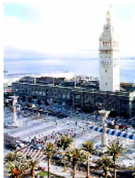
El nuevo look del sector del Edificio Embarcadero