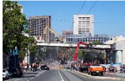
La demolición comienza