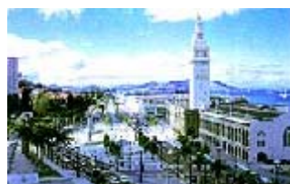
La nueva explanada al frente del edificio Embarcadero