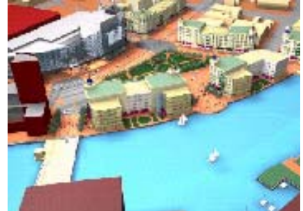
Las posibilidades aún se están estudiando para el espacio liberado