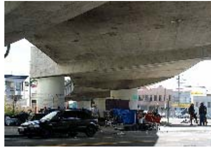
Deterioro urbano aledaño