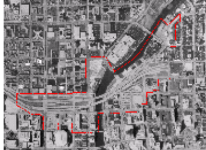
Más de 10 hectáreas del centro serán liberadas para desarrollo