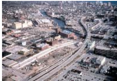
La Park East

y el centro de la ciudad, revitalizando el área e impulsando los planes de Corea de tener una capital moderna, más amigable, más "caminable", cuidadosa del medioambiente, todo dentro de un Plan de Transporte que ayude a convertir a la ciudad en el centro financiero por excelencia de Asia.