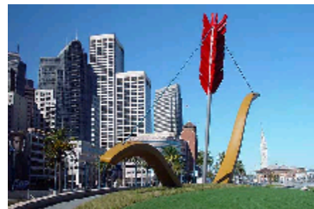
Áreas verdes y esculturas adornan el nuevo Embarcadero