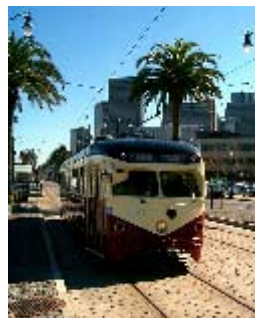
Un tranvía corre ahora por Embarcadero