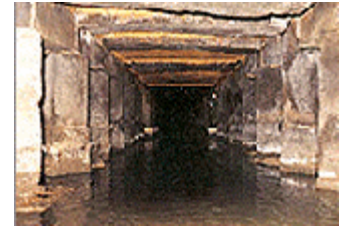
El Cheonggyecheon enterrado