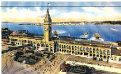
Bosquejo del edificio del Embarcadero en sus años mozos.

del sector y que pusiera fin al deterioro circundante. El 30 de marzo de 2003 la autopista se cerró para que la gente celebrara y caminara (como nunca lo había hecho) por la mole a punto de desaparecer. La demolición comenzó en abril.