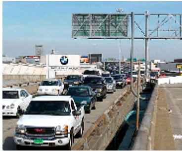
La Autopista Central