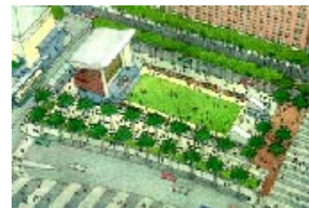
El proyecto de Pabellón, por materializar en el resto del espacio abierto que dejó la autopista