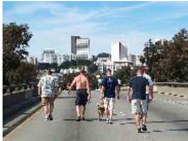
Por única vez, la autopista fue abierta a caminantes que se despidieron de ella