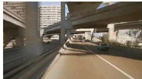
La autopista (la imagen es de una película)