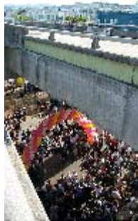
Celebrando la pronta demolición