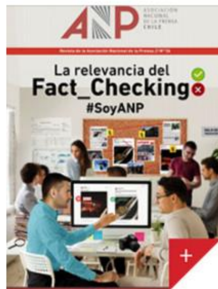
Revista ANP N° 56