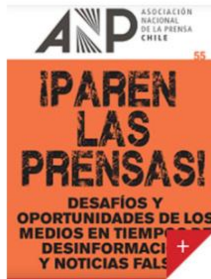
Revista ANP N° 55