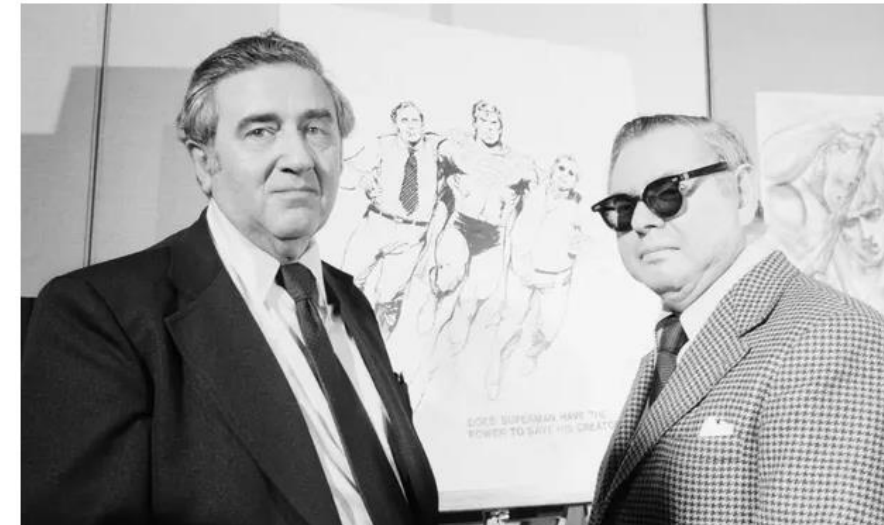
▲ Superman creators Jerry Siegel and Joe Shuster, who signed away their rights to royalties for $65 apiece in 1938.

/// One creator told the Guardian that he and other creators sometimes take pictures of action figures of their characters in shops, to demonstrate that their cheques are short