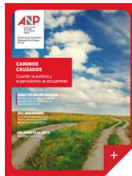
Revista ANP N° 54