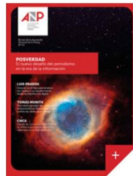
Revista ANP N° 53