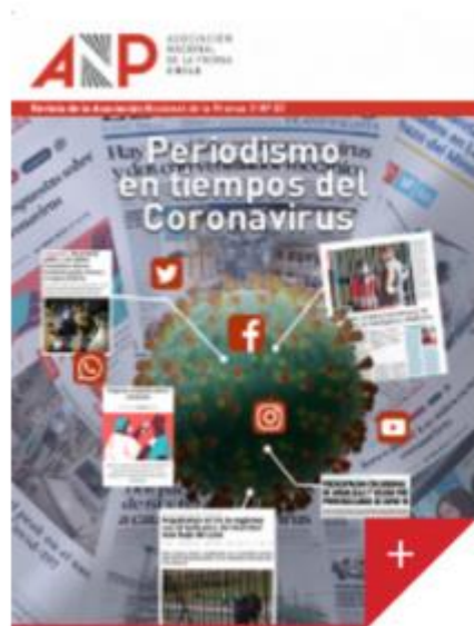
Revista ANP N° 57