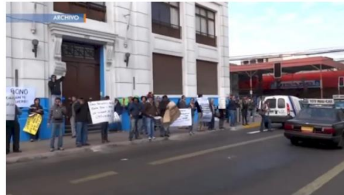
Antofagasta TV Publicado 10 de mayo de 2021

Tras no llegar a acuerdo, los trabajadores de la Empresa Periodística del Norte (Emelnor) hicieron efectivo el comienzo de una huelga legal el pasado viernes.