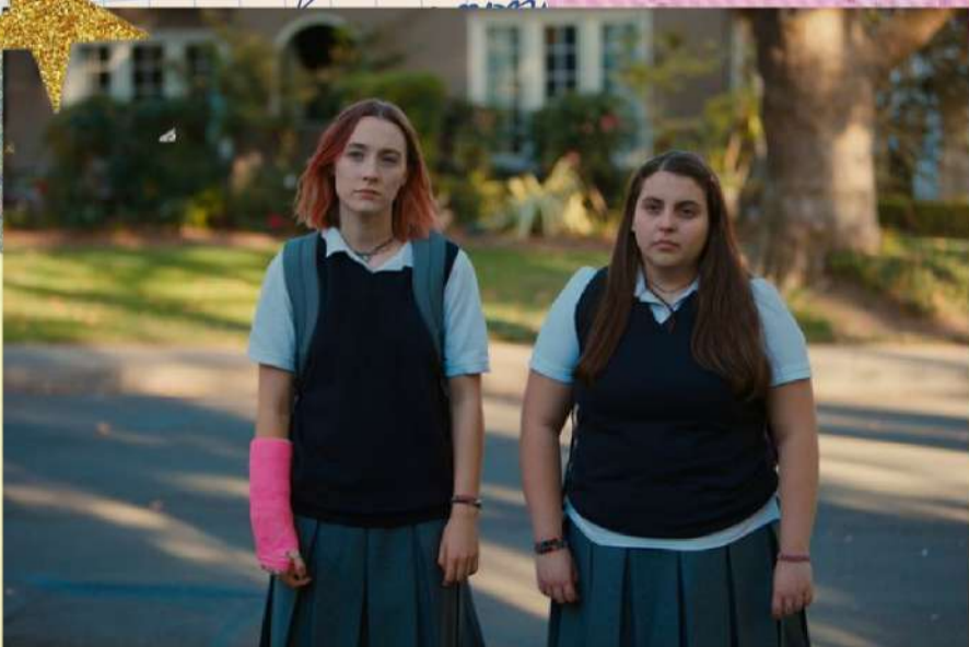
Ladybird como ejemplo de ritmo de montaje

El sonido, si bien naturalista en los diálogos y en los ambientes, también se pondrá en función de la animación, avivando su aparición e irrumpiendo la naturalidad del corto, otorgándole la sensación de fantasía. Sonidos de papeles y de otras materialidades que se ocupen, además de otros sonidos más fantásticos como el típico tintineo de una iluminación brillante, el coro de unos ángeles, y otros más, ayudarán no solo a darle carácter a la animación, pero también nos estarán recordando constantemente como los demás ven a Ángel.