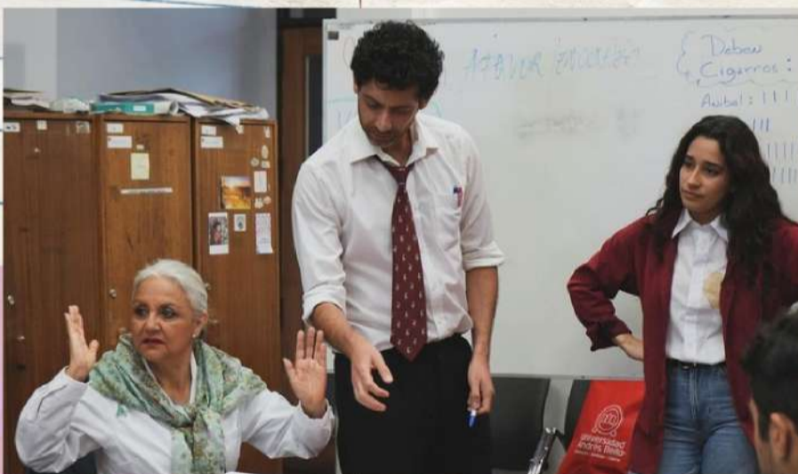
serie ficción 4to año "Sala de profesores" (WIP) co-dirección, guion y asist. de dirección https://drive.google.com/file/d/12t8FoK1io3QK8bx-SrcR06gxZkgcfpxp/view?usp=share_link