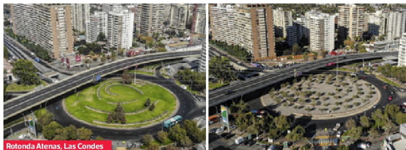
Rotonda Atenas, Las Condes

Santiago sin agua: las áreas verdes tras las medidas de racionamiento