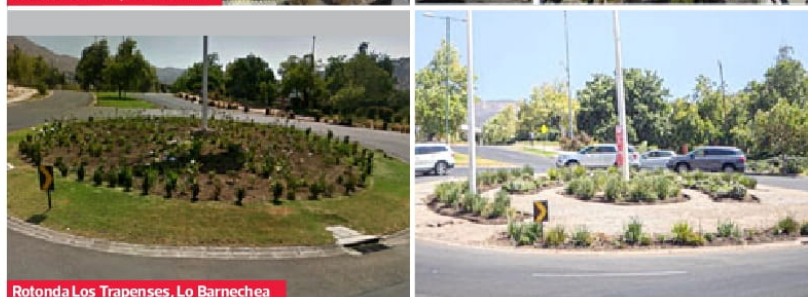
Rotonda Los Trapenses, Lo Barnechea