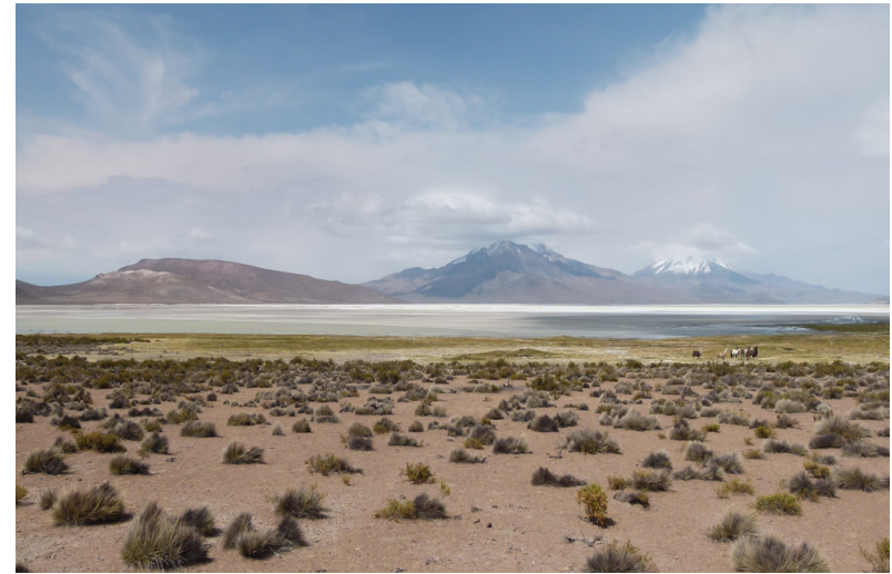
El altiplano chileno (Salar de Surire)