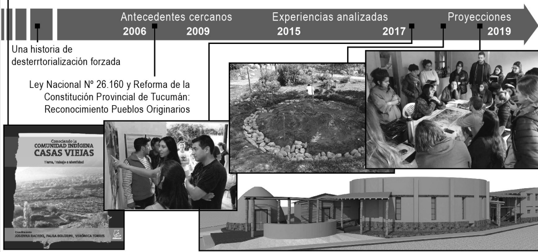
Figura 3. Cronología de la experiencia en la Comunidad Indígena Casas Viejas: fases del proceso participativo desarrollado y de la dialéctica entablada con la academia.