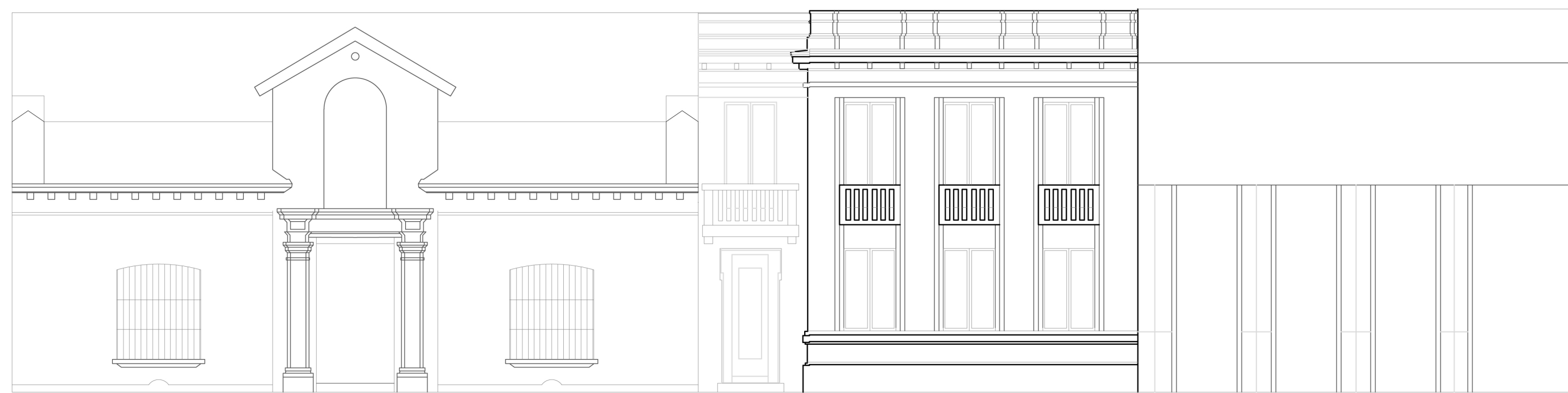
ELEVACION FACHADA ESC 1:100