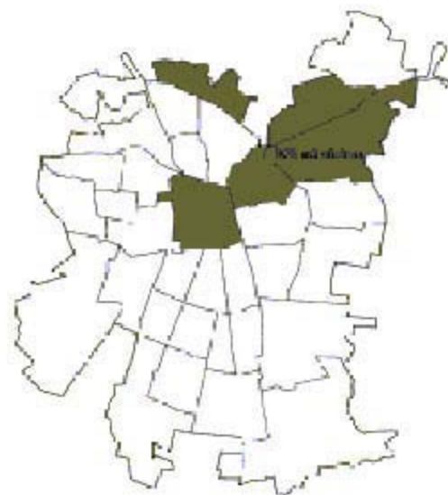
Plano 3. Localización del 96% del total de metros cuadrados de oficina

La nueva tendencia de localización de la edificación destinada a oficinas, es tal vez el rasgo más sobresaliente: este uso del espacio comienza a retirarse del centro de la ciudad. El 96% del total de metros cuadrados está concentrado en 5 de las 34 comunas del Gran Santiago. Es un fenómeno que muestra cómo el proceso de globalización está reestructurando las ciudades, al crear nuevas zonas de servicios, con nuevos patrones de diseño, de localización, complementadas con equipamientos urbanos de alta calidad.