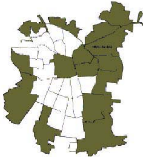
Plano 1. Localización del 90% de metros cuadrados aprobados, 1990/1996

El crecimiento de la ciudad se ha dado siguiendo sólo las tendencias del mercado: