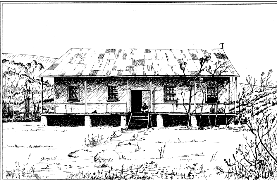
Fig. 4.- La casa del administrador del rancho, Mataveri alrededor de 1914. Las fundaciones de piedra son de las antiguas casas de los nativos. Redibujado por Ole J. Heggen de Routledge, op.cit. (véase nota 16).