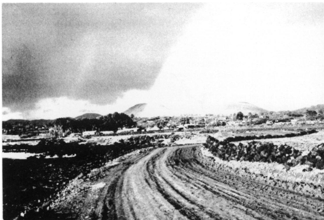
Fig.1.- Pueblo de Hangaroa, Isla de Pascua 1974, desde el Sur. A esa fecha, esta era la única área extensamente arbolada de la isla.

Hasta los 1860s, Isla de Pascua sufrió breves, aunque a menudo violentos, encuentros con las exploraciones de barcos europeos. En esa época, Oceanía era una fuente de trabajadores kanakas para trabajar en las minas y plantaciones de la cuenca del Pacífico. Siendo la isla habitada de Polinesia más cercana a Perú, aun cuando está a más de 2000 millas de la costas Sudamericanas, Isla de Pascua se consideró un reservorio de mano de obra para los emprendedores peruanos. Desde 1859 hasta 1862, aproximadamente 1000 isleños Rapanui fueron secuestrados o forzados a abandonar su isla hacia plantaciones, minas de guano, y ciudades costeras de Perú. El traslado, emigración y las enfermedades contagiosas rápidamente redujo la población nativa de casi 3000 o 4000 personas a principio del siglo 19, a menos de 200 personas a principio de la década de 1870s. 4