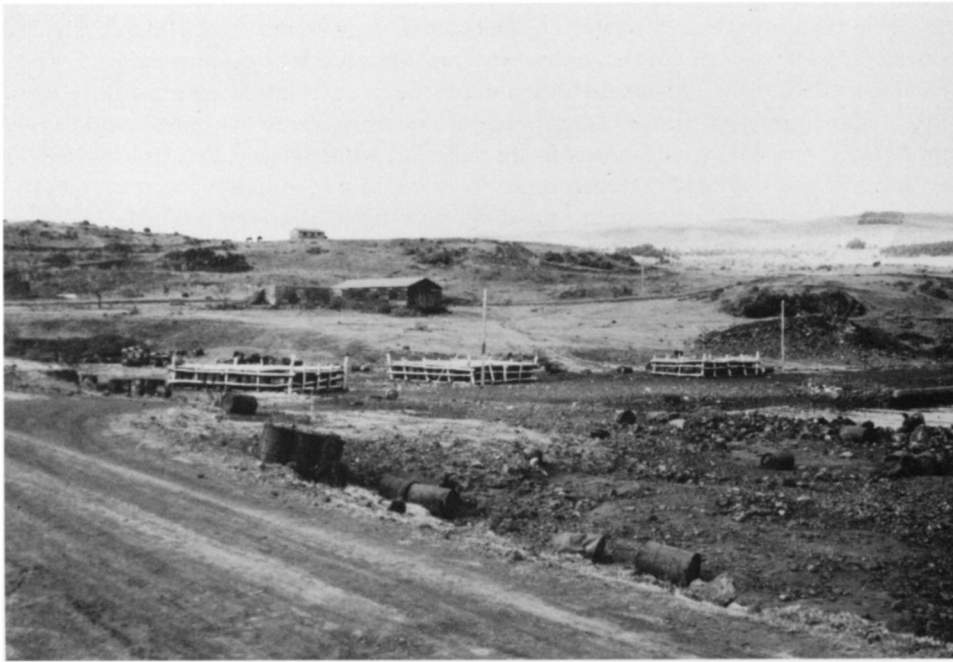
Fig.5.- Balsas utilizadas para transportar carga ligera entre Hanga Piko y barcos anclados frente a la costa. Construídas con troncos y tambores, estas balsas estuvieron en uso hast principios de los años 1970s.