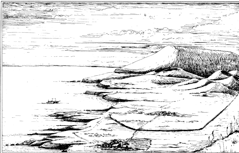
Fig.3.- Mataveri ( cuartel principal de la Compañía en primer plano) y Hangaroa (pueblo de los nativos en el centro), en la época del la I Guerra Mundial. El muro de piedra que rodea el poblado es claramente visible. Redibujado por Ole J. Heggen de Routledge, op.cit. (véase nota 16).