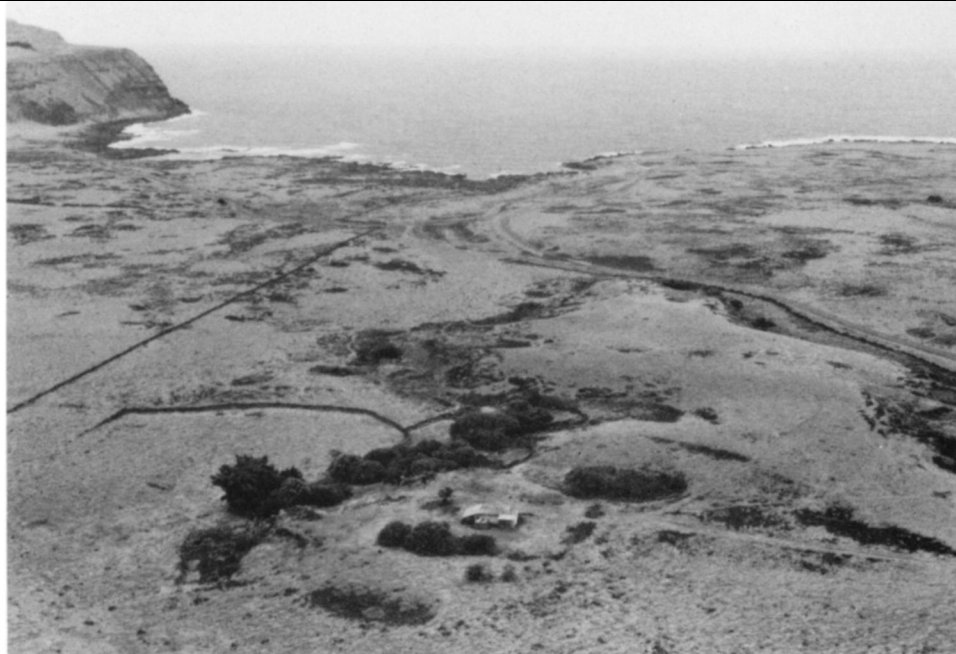
Fig.6.- Paisaje entre Rano Raraku (la cantera de estatuas) y Tongariki, mostrando pastizales, caminos, muros de piedra (pircas), aleros y una cabaña para los pastores.