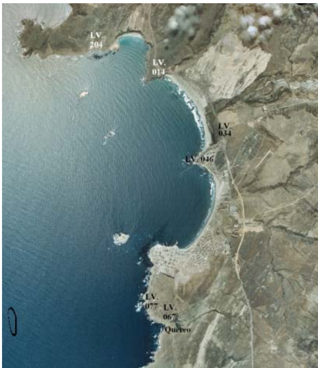
Figura 2. Área de estudio y asentamientos del Holoceno tardío. Study area and late Holocene settlements discussed in text.

Su potencia estratigráfica (entre 30 y 40 cm), en conjunto con la variedad en la explotación de invertebrados y las características de su industria tecnológica, aluden a una funcionalidad residencial, más alejada del litoral. Se planteó que el asentamiento sería asignable al Complejo Cultural Papudo, característico del Holoceno medio, aunque en tiempos más tardíos (Barrera y Belmar 2000).