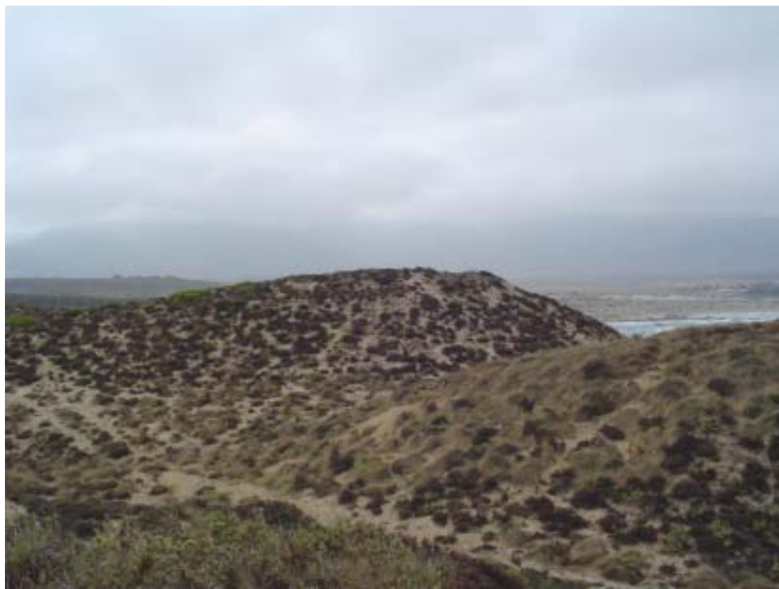
Figura 3. Basurales conchíferos monticulares del sitio de Punta Chungo (LV. 046a). Shell midden mounds at the Punta Chungo site (LV. 046a).

Una descripción casi idéntica podría ser sostenida para Punta Chungo B (LV. 046b). Este asentamiento, muy próximo al anterior (400 m), se emplaza sobre un sistema de dunas y corresponde a un gran montículo de conchal con escasas evidencias superficiales (Jackson y Méndez 2004). Una intervención de 6 unidades de excavación (18 m 2 )