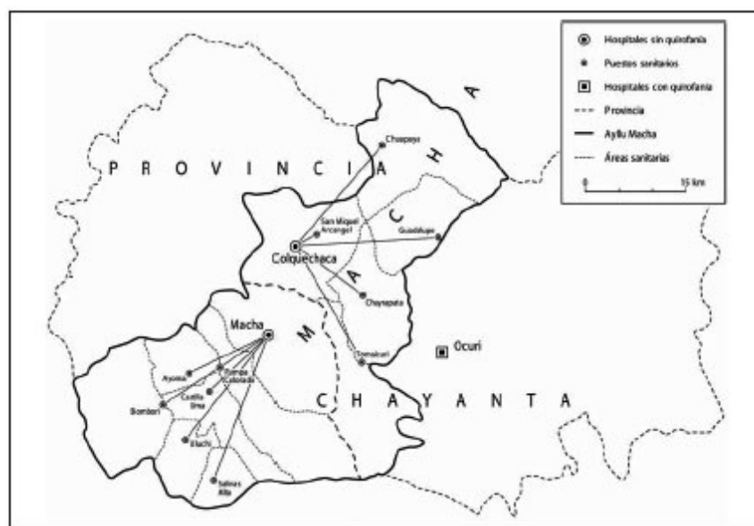
Figura 1. Mapa de la Provincia de Chayanta (Bolivia) con los hospitales y puestos sanitarios en Macha.

El proyecto más amplio, en el que se enmarcó esta investigación, enfatizaba los peligros que afectan a las madres, y sólo secundariamente la perspectiva del bebé. 6 Pensamos que las políticas de salud reproductiva han desplazado la atención prioritaria desde la madre hacia el bebé, de una manera a menudo perjudicial para las mujeres. Esta opinión fue compartida por nuestros informantes: la muerte de un bebé es motivo de lágrimas y lamentaciones, pero no tiene ni remotamente el significado traumático de la muerte de la madre, quien normalmente es un miembro en plenas funciones dentro de la sociedad local. De ahí que nuestra investigación tuviera una dimensión aplicada: la reducción de la mortalidad materna, y esto condujo a un énfasis sobre las ideas y prácticas referentes a la enfermedad perinatal y la muerte.