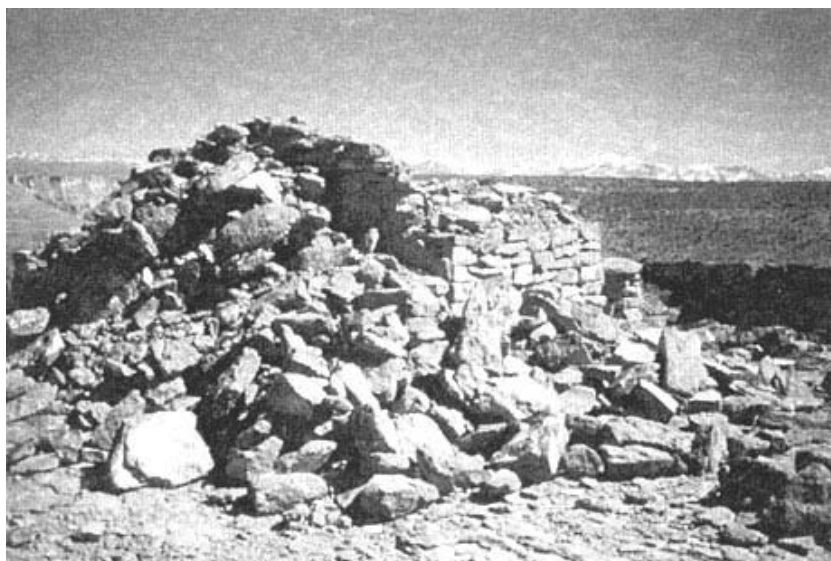
Figura 2. Usno , Cerro Verde.