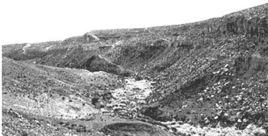
Figura 4. Camino del Inka, Incahuasi Inka.