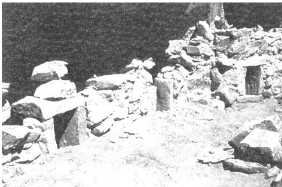
Figura 3. Collcas , Incahuasi Inka.

De acuerdo a ello, se cumplirían los requisitos que a juicio de los últimos avances teóricos (p.e. D'Altroy y Earle 1985 ; D'Altroy y Harstof 1984 ; Earle 1994 ; Earle y D'Altroy 1989 ) permiten definir a esta región como hegemónica y territorialmente integrada al Tawantinsuyo. De este modo, se vuelve relativa la situación marginal de la zona, proponiéndola como un verdadero enclave local al servicio del Estado que no sólo producía recursos básicos ( staple finance ), sino también bienes suntuarios y riqueza ( wealth finance ) para su burocracia (p.e. metales), y proveía la energía humana para la imposición, mantenimiento y reproducción del Imperio en los Andes del sur. En este sentido, se postula que las poblaciones del Intermedio Tardío del Loa y del Desierto de Atacama en general entraron bajo un "dominio directo" del Inka. Pero, sobre todo, se amplía y supera esta antigua discusión nacional del control directo o indirecto, ya que toda esta situación material se traduce en oposiciones sugerentes: instalaciones y objetos exclusivos del Inka, otros de aspecto local y poblados locales con intrusiones incaicas. Sus expresiones materiales funcionan como indicadores sensibles que refieren a situaciones sociales y políticas diferenciales según los ejercicios de poder involucrados y no particularmente a poblaciones determinadas como supuestas colonias altiplánicas.