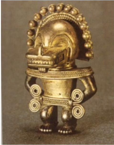
Colgante antroposomorfo. Técnica cera perdida. Ubicación temporal: siglos X al XVI. Peso 11.35 gramos