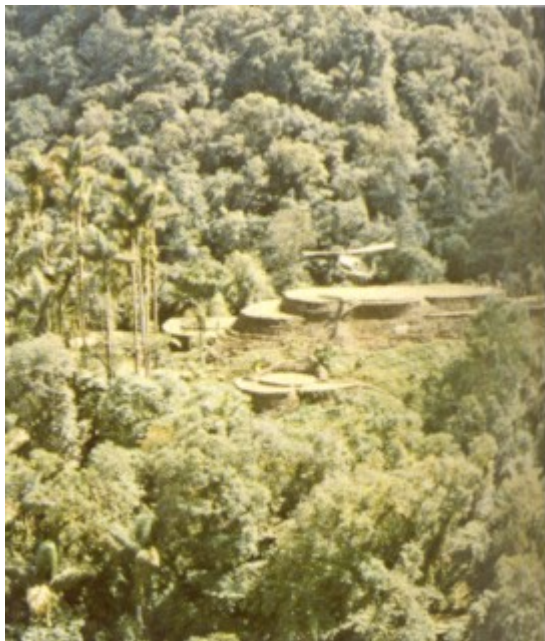
Vista aérea, terraza principal de Ciudad Perdida (Buritaca-200)