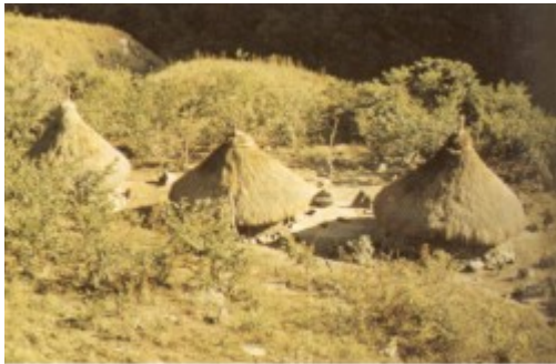
Finca Kogi: la construcción de la izquierda para el almacenamiento de productos agrícolas y sitio de alojamiento de los huéspedes. La del centro es la vivienda masculina y la derecha es vivienda femenina y cocina.

misma especialización de las poblaciones y regiones facilitó en cierta forma la quiebra, al no poder suplirse con productos de las tierras bajas, como sal, pescado, moluscos, mantas de algodón y otros. El estado de guerra contribuyó a la crisis del comercio, la cual seguramente repercutió en la función misma de algunos poblados. A esto se agrega la destrucción de aldeas, el decrecimiento de la población -principalmente por pestes como la viruela, muertes en combate o por ajusticiamiento y la pérdida de líderes 19 . Las aldeas eran abandonadas, al igual que los caminos. Rápidamente la vegetación cubrió las antes transitadas rutas de comercio. Los indígenas sobrevivientes entraron a formar parte de las encomiendas cercanas a Santa Marta, y algunos lograron replegarse a las partes altas de la Sierra, aislándose de todo contacto con el invasor español. Estos últimos empezaron a crear un orden cultural acorde con las nuevas circunstancias de vida.