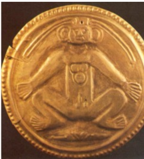
Placa repujada Ubicación temporal: siglos III al IX Peso 25.05 gramos