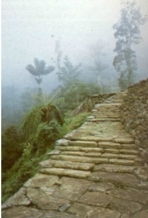
Escalera del sector, eje central de Ciudad Perdida

El final del período clásico se da con los primeros desembarcos de los españoles (1501-1502), que traen consigo enfermedades hasta entonces desconocidas, como el sarampión, la viruela y algunas afecciones respiratorias, cuyas repercusiones se hacen sentir al empezar a diezmar rápidamente a la población indígena.