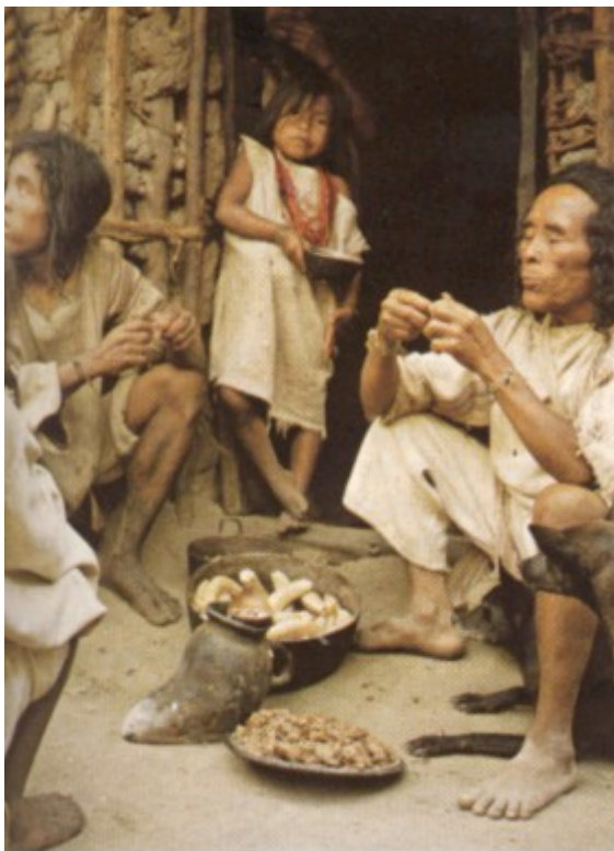
La vasija en forma de sueco se usa para cocinar guandú (variedad de frijol) la olla contiene plátano cocinado y el plato mantata ( plátano seco y cocinado), el plátano fue introducido a la llegada de los españoles.

El indígena continuó aprovechando la verticalidad climática, ya no desde el nivel del mar sino a partir de los 1.000 m.s.n.m. hasta los páramos, rotando con la familia sus diversas fincas, a fin de lograr una producción que les permitiera sobrevivir en suelos poco aptos para la agricultura sin