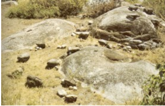
Sitio de adivinación o ritual a las afueras del pueblo de Taminaka (río Palomino)

es posible medir cuál pudo ser el efecto de la desintegración cultural vivida durante el siglo XVI, pero se notan cambios fuertes, como el paso de una vida sedentaria al seminomadismo que ahora existe entre los coguis.