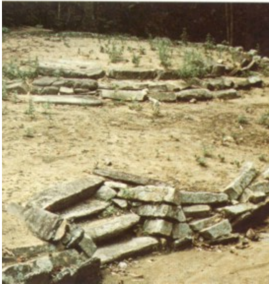
Terraza y basamento de vivienda en Pueblito

la llamada "cerámica tairona" del litoral, caracterizada por los tipos rojo y negro sobre rojo 10 . La diversidad en las formas de atributos cerámicos (bordes, bases, decoraciones) se reducen, en clara tendencia a la estandarización, con lo cual se presenta una aparente involución. Una explicación a este fenómeno es que la cerámica pasa a ser una actividad especializada en centros dedicados a su producción; por ejemplo, el asentamiento de Bonda era, hasta hace pocos años, conocido como centro alfarero. Ciertamente es que, desde los comienzos del período temprano, la Sierra Nevada de Santa Marta, por sus características ecológicas particulares, posibilitó que se diera la especialización de aldeas agrícolas, pesqueras o de otros bienes de uso y de consumo en un sentido horizontal y vertical, dada la favorable diversidad climática en cortas distancias 11 .