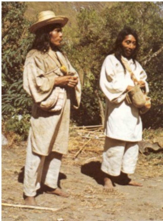
Indígena Kogi de Takina e indígena de SAN Antonio

En cuanto al particularismo regional, éste continuó igual hasta el presente. Cada valle siguió siendo independiente en sus decisiones, con una estructura administrativa propia; lo mismo ocurre con la jerarquía de los mamás, siendo ésta de carácter regional. En los últimos años el Estado ha tratado de imponer un gobernador indígena como autoridad máxima de los coguis, pero éste no es reconocido en ninguno de los valles. La religión como institución ha sido, al parecer, la menos afectada, puesto que ha conservado numerosas tradiciones, algunas de las cuales cumplen una función tan importante hoy día como en el pasado, y ha sido uno de los aspectos que más han contribuido a reforzar la identidad étnica. Al examinar sucesivas descripciones, desde el siglo XVIII hasta el presente, vemos que han sido escasos los cambios en los coguis, pese a la presión que han ejercido la Iglesia Católica y la colonización durante los últimos dos siglos 21 . Esto se debe a los fuertes mecanismos de control que ejerce la tradición religiosa de los mamás y que ha estado acorde con su realidad cotidiana. Esta situación es el fruto del conocimiento acumulado durante siglos acerca del manejo del ambiente, de la agricultura, de la astronomía y de otros aspectos de la naturaleza particular de la Sierra Nevada.