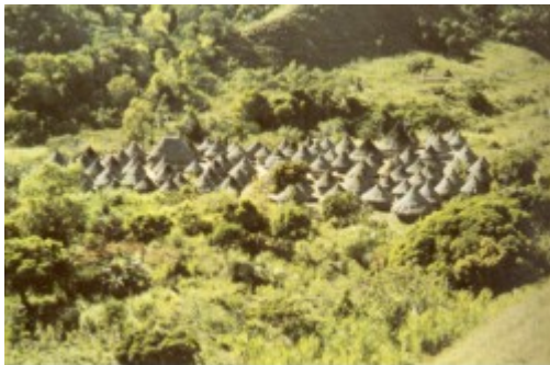
Pueblo de Taminaka, río Palomino