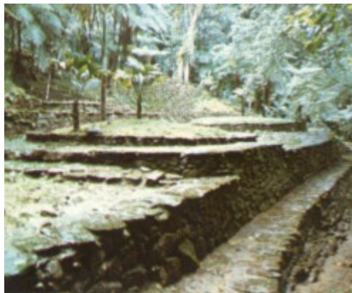
Terrazas sector del cacique, Ciudad perdida