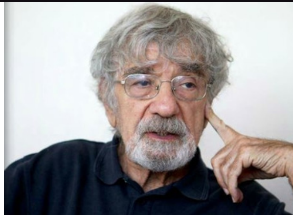
Prof. Humberto Maturana (Q.E.P.D.)