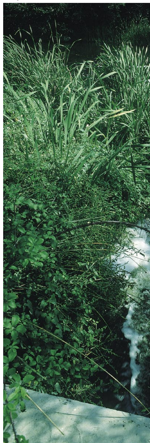
Desagüe de fábrica al río Jarama.