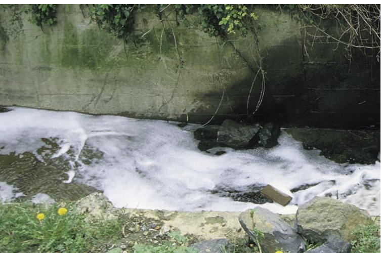
Vertido lixiviados.