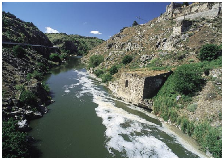
Río Tajo. Vertidos.

Por otra parte, como es común a todos los regímenes de responsabilidad, la Directiva recoge una serie de supuestos que en unos casos eximen de responsabilidad al operador y en otros actúan como circunstancias atenuantes a tener en cuenta a la hora de fijar la participación del responsable en la financiación del coste de la indemnización. Entre las primeras, el apartado 3 del artículo 8 incluye dos casos tradicionales: