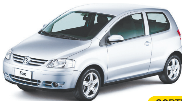
Nuevo Volkswagen Fox.

Busca la pregunta del día que se publicará de lunes a domingo en el cuerpo C de El Mercurio o busca las preguntas en EMOL. Envía un mensaje de texto desde tu teléfono móvil al número 4556 (*), digitando el número de la pregunta, espacio y la letra de la alternativa correcta (ej. 1 A), y participarás semanalmente en el sorteo de espectaculares premios: