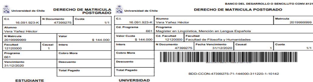
Imagen 8: Cupón de Pago

Debe tener presente, que los estudiantes internacionales registrados con su Pasaporte en los Sistemas Universitarios NO podrán pagar a través de Servipag Caja o Servipag Express, solo pueden hacerlo quienes cuenten y hayan sido registrados con RUN Chileno.