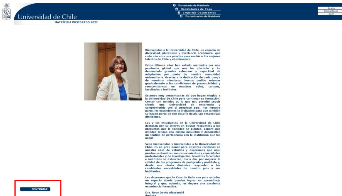
Imagen 2: Página de bienvenida

Al ingresar los datos solicitados, usted será dirigido a la página de bienvenida (imagen 2)