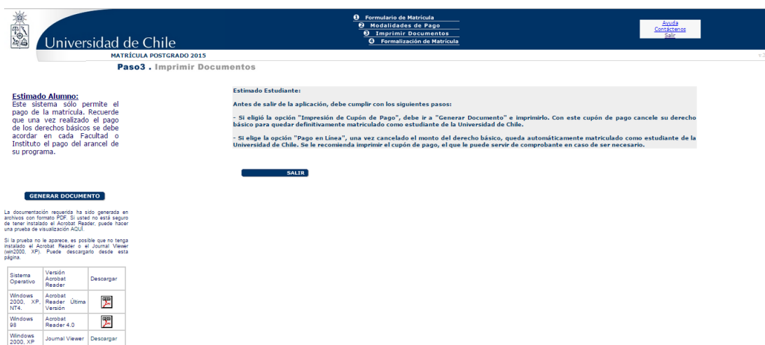
Imagen 8: Imprimir Documentos

Si elige la opción para imprimir el cupón de pago, avanzará a la pantalla que le permitirá imprimir los documentos y el sistema le dará la opción de generar la boleta pinchando el botón “ GENERAR DOCUMENTO ”, que aparece en el costado izquierdo de la pantalla, tal como se muestra en la imagen 8.