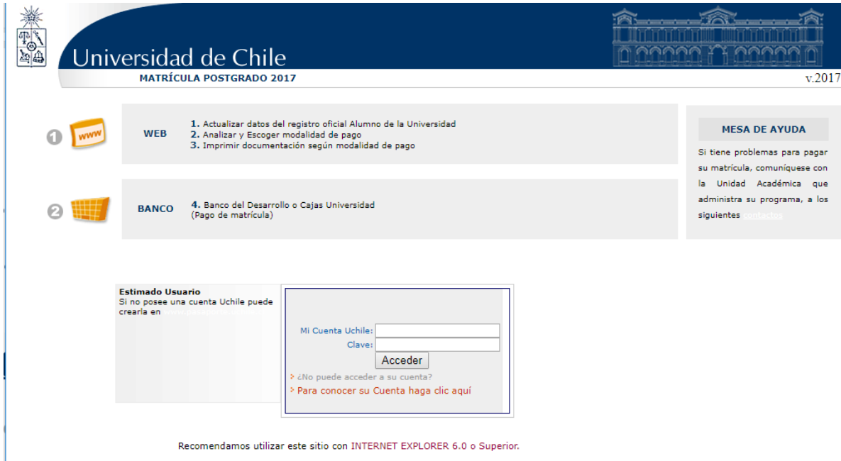
Imagen 1: Acceso a página de matrícula

Como se muestra en la imagen 1, se le solicitará ingresar con su cuenta Uchile y su clave.