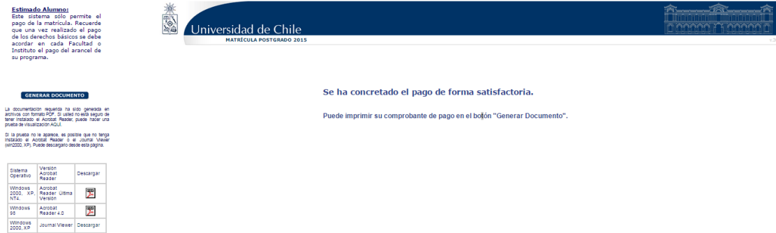
Imagen 11: Confirmación de pago

Una vez finalizada la transacción, quedará automáticamente matriculado en el programa y podrá imprimir su comprobante pinchando el botón “GENERAR DOCUMENTO” como se muestra en la imagen 11.