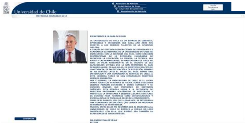
Imagen2: Bienvenida del rector

Al acceder al sistema, ingresará a la página de bienvenida (imagen 2).