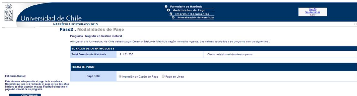
Imagen 7: Modalidad de pago

Al presionar el botón “ ACEPTAR Y SEGUIR ”, avanzará a la modalidad de pago. En este punto debe escoger si realizará el pago en línea, o imprimirá el cupón de pago, para realizar el pago en las cajas habilitadas. Al seleccionar una de las dos opciones presione el botón “ CONTINUAR ”.